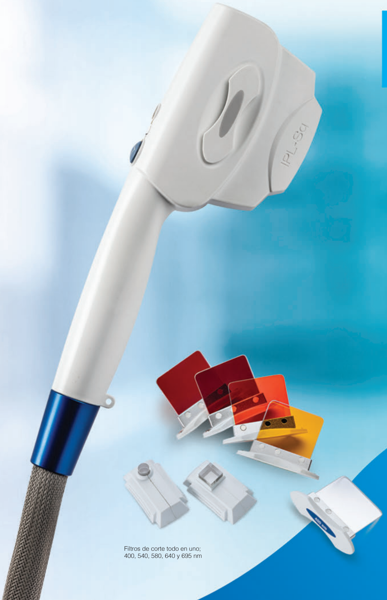
Filtros de corte todo en uno; 400, 540, 580, 640 y 695 nm